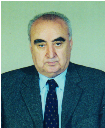
ირაკლი ჟორდანი საქართველოს მეცნიერებათა ეროვნული აკადემიის აკადემიკოს-მდივანი

სამეცნიერო-ტექნოლოგიური პროგრესი, რომელიც, უპირველეს ყოვლისა, გულისხმობს წარმოების ეფექტიანობის ამაღლებას, ხალხის ცხოვრების დონის მნიშვნელოვან გაუმჯობესებას, ახალი, პროგრესული იდეებისა და მეცნიერებატევადი, კონკურენტუნარიანი პროდუქციის უწყვეტ ნაკადს, სრულად ემყარება სამეცნიერო-კვლევითი, საკონსტრუქტორო თუ საინჟინრო სამუშაოების ზუსტ გათვლებს და ამ მიმართულებით ჩატარებული ექსპერიმენტების შედეგებს.